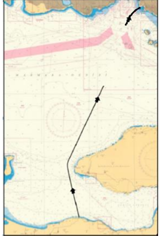
YARIŞ 2 (12 AĞUSTOS 2017) ROTALARI