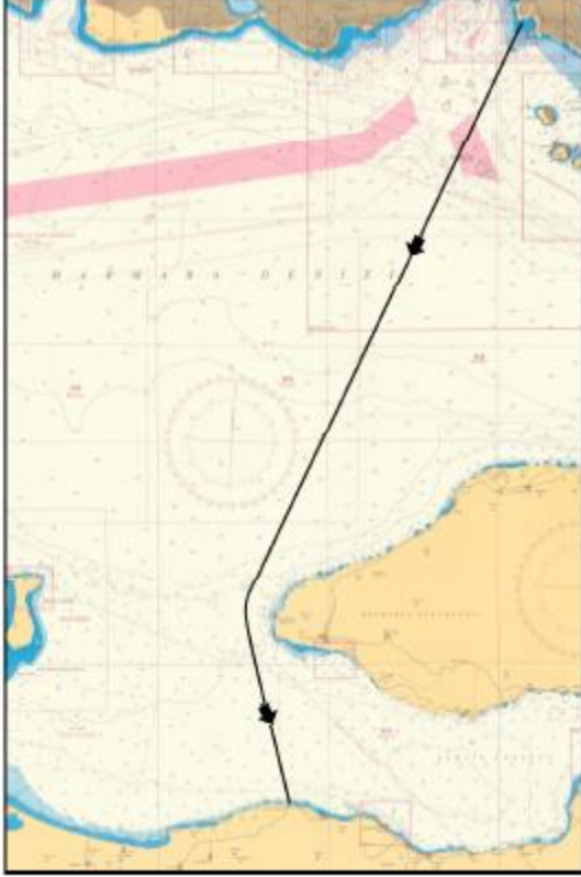
YARIS 1 (11 AĞUSTOS 2017) ROTASI